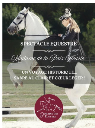
Nuit Européenne des musées – Spectacle équestre « Madame de la Paix Fleurie »