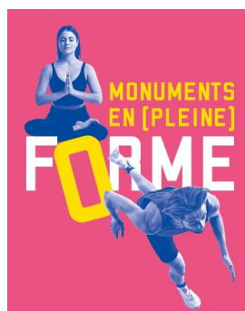
Monuments en (pleine) forme !