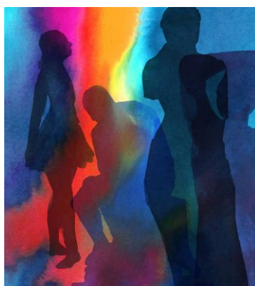
Nuit Européenne des Musées