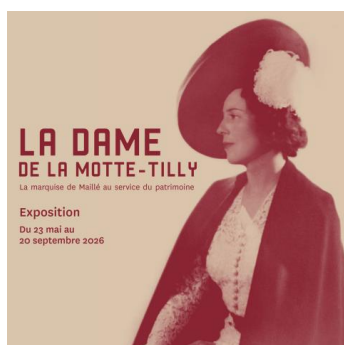
La Dame de la Motte-Tilly : la marquise de Maillé au service du patrimoine